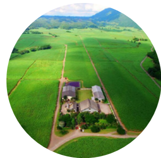
Worthy Park Estate auf Jamaika