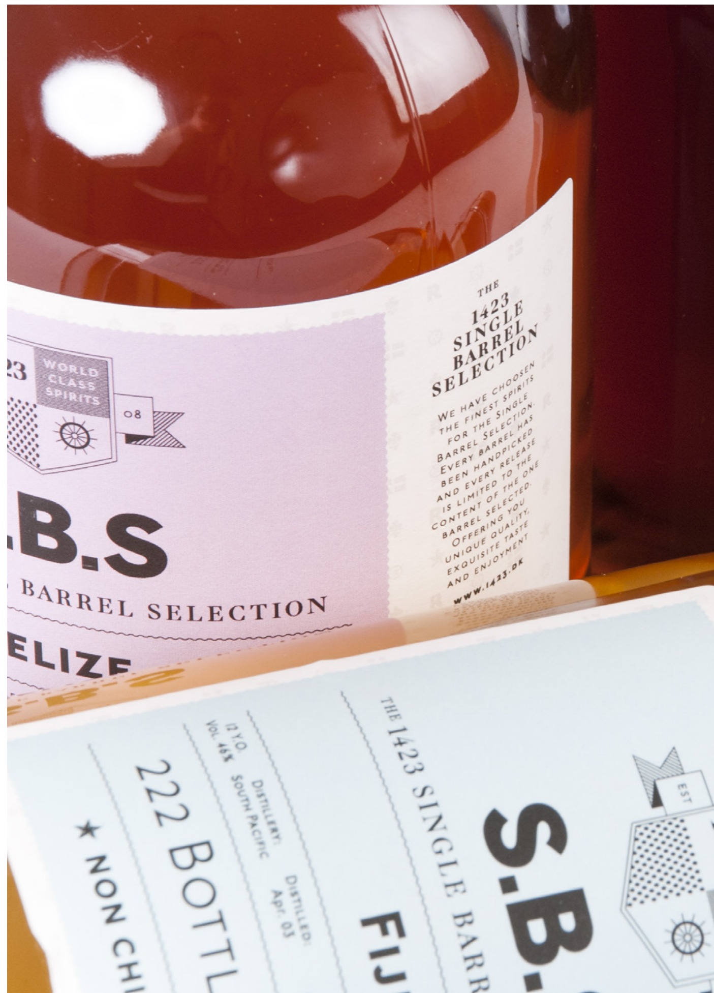
Single Barrel Selection von 1423