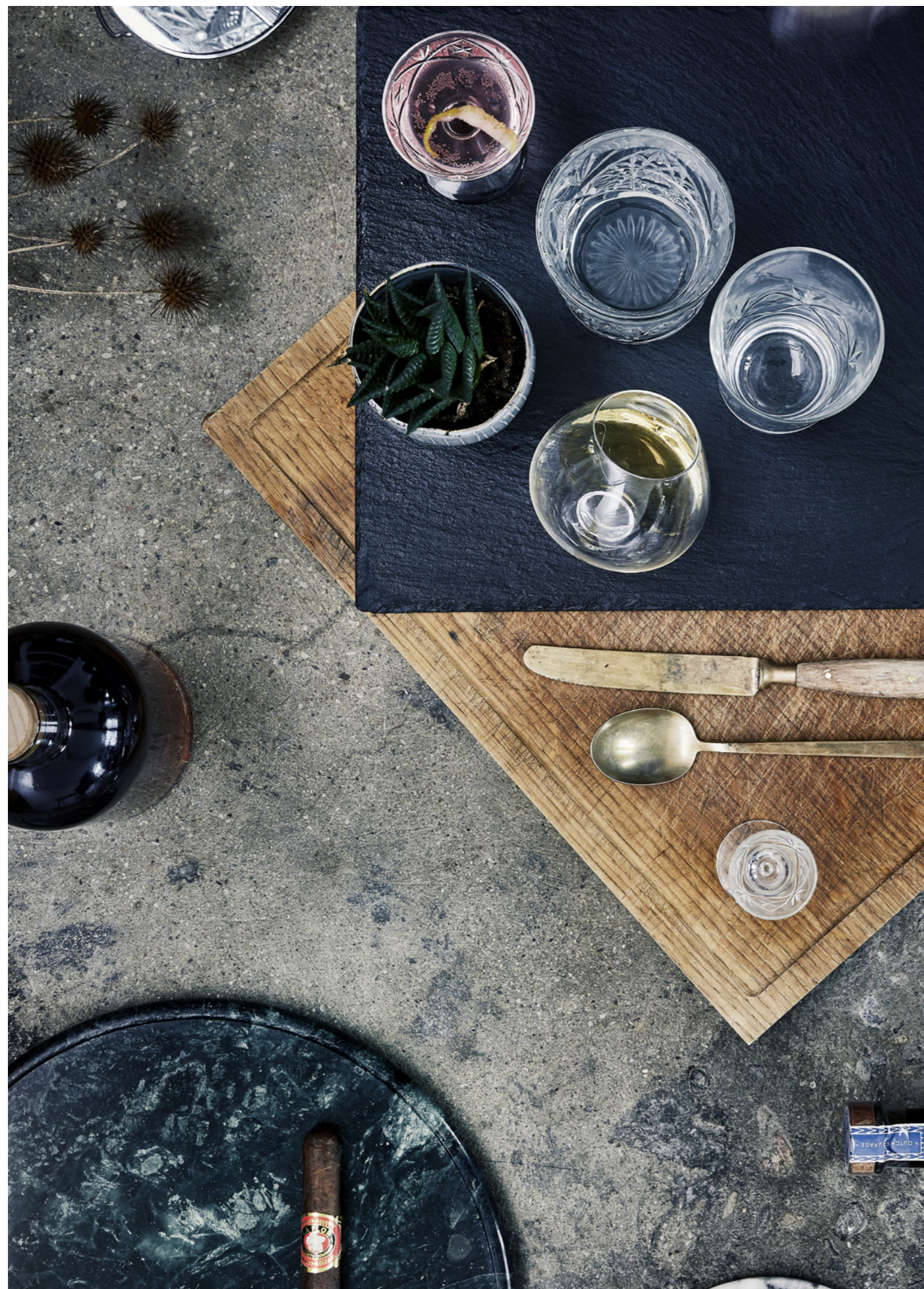
Hinter der Bar mit 1423