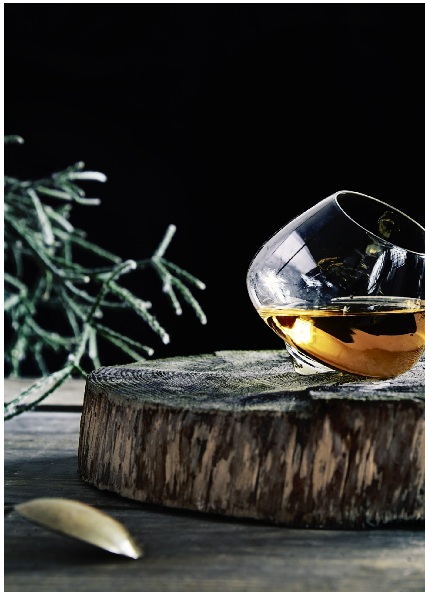
Ron Esclavo XO Cask in einem Glas von Normann Copenhagen