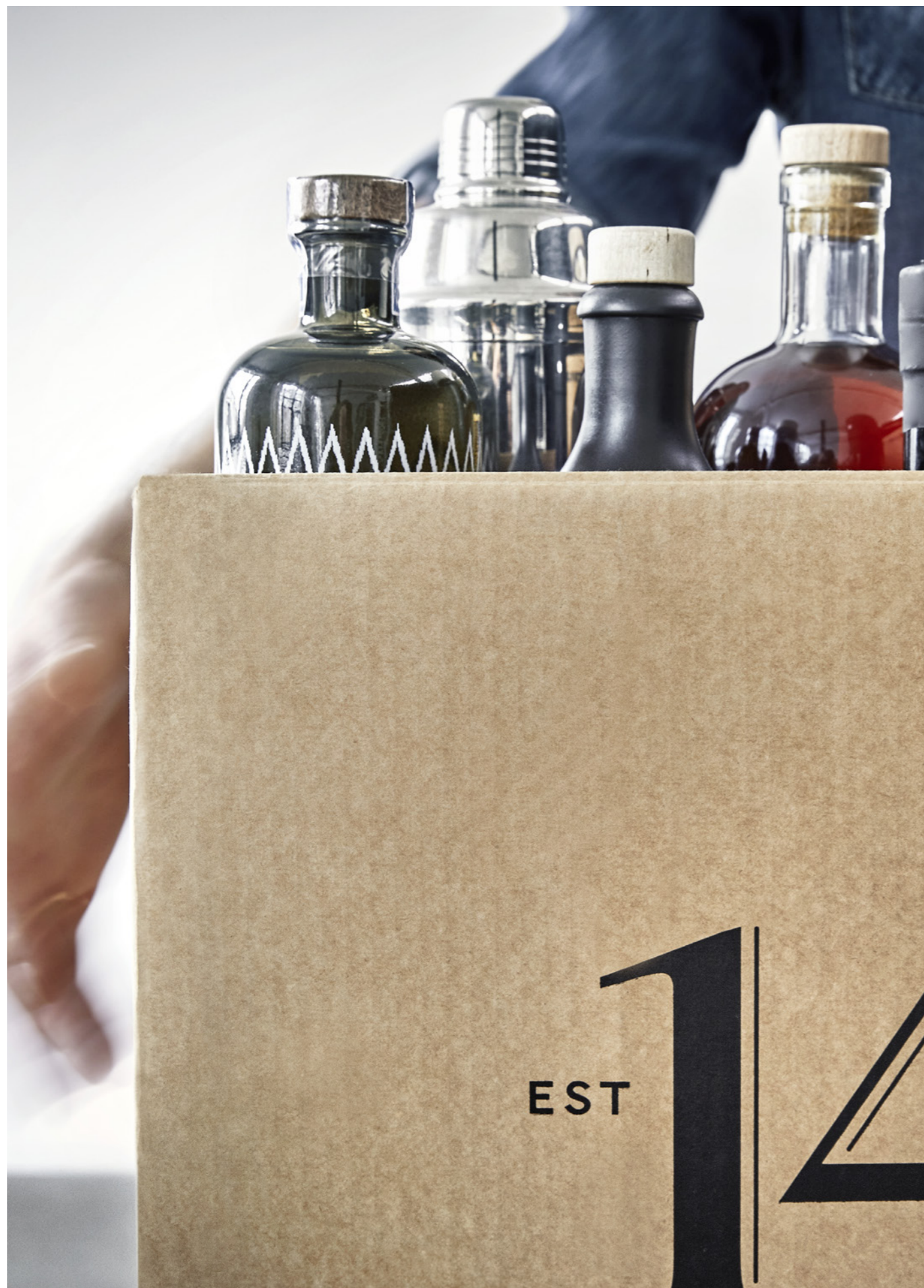
Ein Auszug aus der Produktpalette von 1423