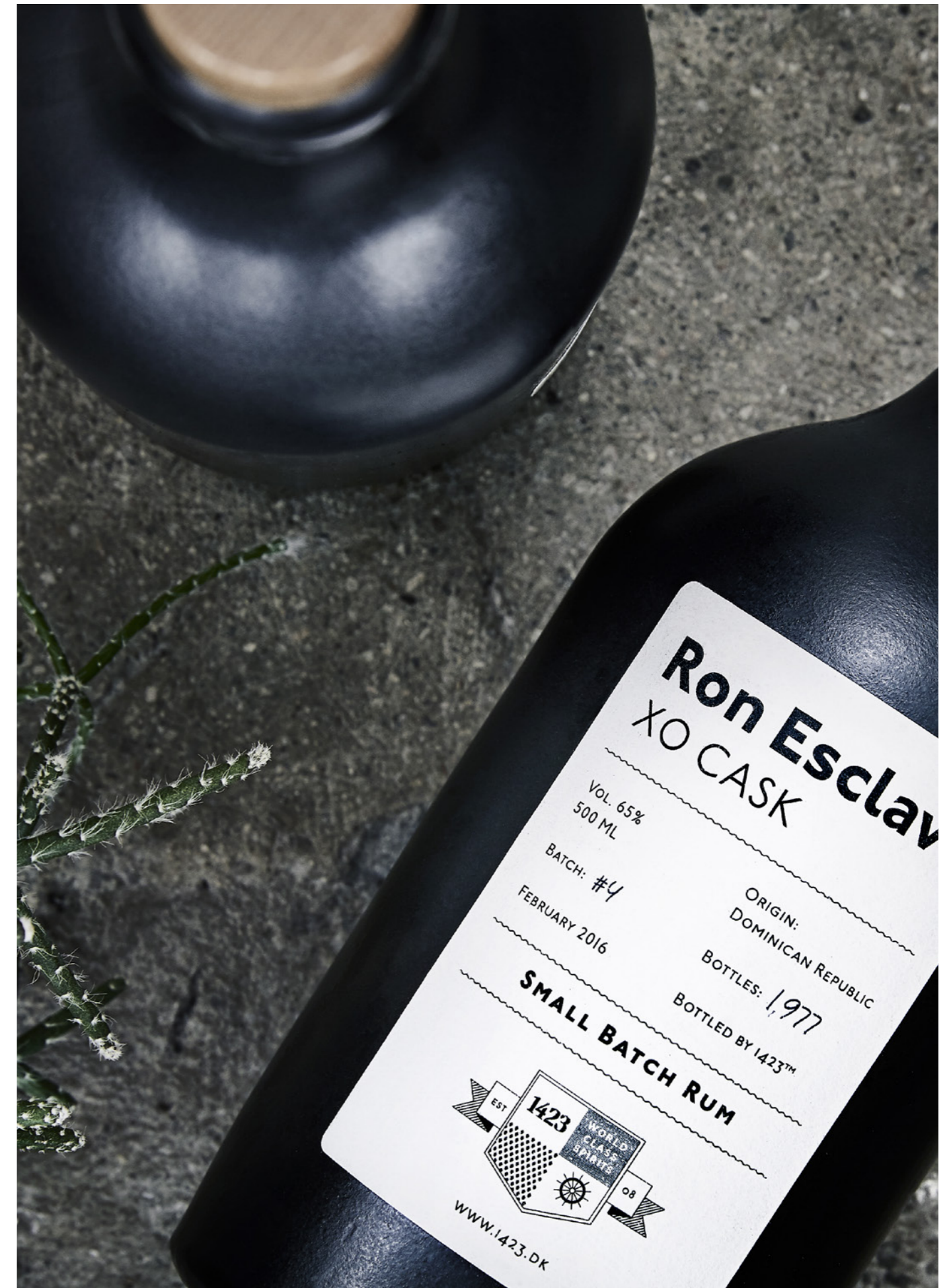
Ron Esclavo XO Cask von 1423

Ron Esclavo – „der Rum der Sklaven“ gedenkt der Sklaven, die den höchsten Preis dafür bezahlen mussten, dass der Rum sich bereits im ersten Produktionsjahr ausgebreitet hat, und derer, die aufstanden und gegen die Sklaverei kämpften. Auf sie alle stoßen wir heute an. Ron Esclavo – from slavery to bravery!